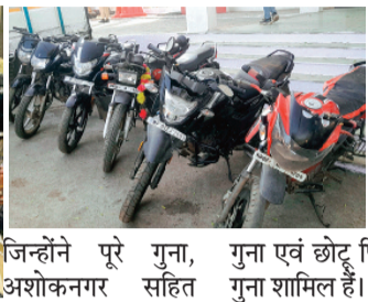
जिनमें पूरे गुना, अशोकनगर सहित