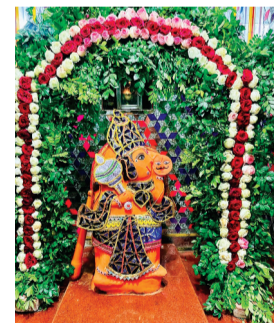
मां बगलामुखी मंदिर के बाहर स्थित श्री सूर्यमुखी बालतीर्थ हनुमान जी का आकर्षक श्रृंगार कर आरती की गई।

नलखेड़ा। तिथि अनुसार अयोध्या में प्रसू श्रीराम लला की प्राण प्रतिष्ठा की द्वितीय वर्षगांठ पर विभिन्न मंदिरों में धार्मिक आयोजन हुए। पौष माह शुक्ल पक्ष की द्वादशी तिथि अनुसार बुधवार को