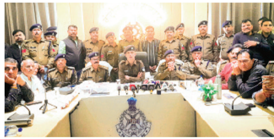
हरिभूमि न्यूज़ ॥ राजगढ़

गिरफ्तार आरोपियों के लिए न्यायालय से मांगी गई पुलिस रिमांड एसपी बोले-अन्य आरोपी भी जल्द होंगे सलाखों के पीछे