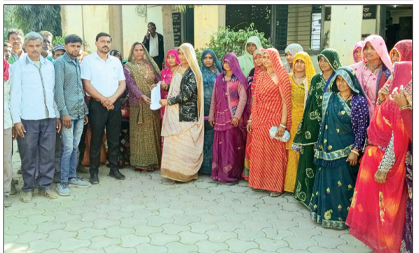
हरिभूमि न्यूज़ ▶▶ चाण्डा